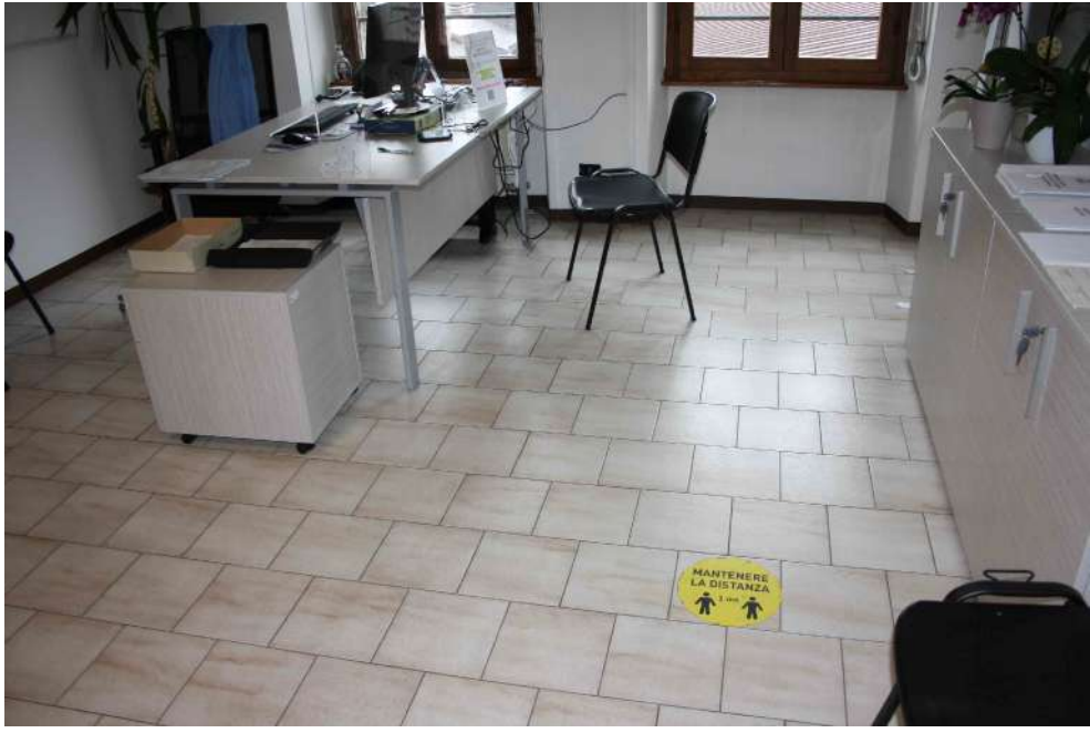
FOTOGRAFIA 06: UFFICIO IMPIEGO - PAVIMENTAZIONE IN GRES 30X30