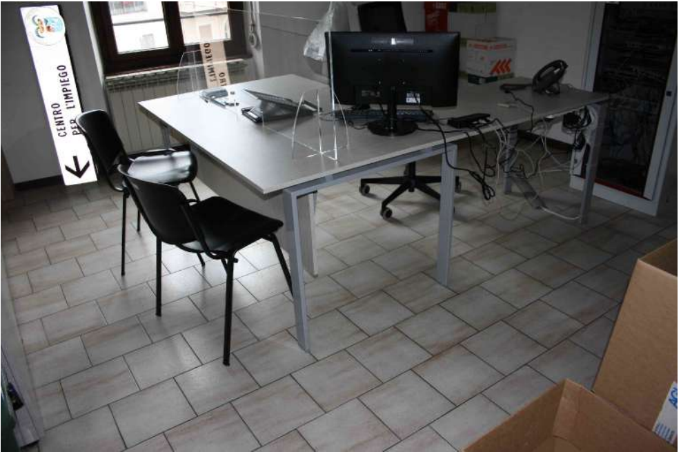
FOTOGRAFIA 05: UFFICIO IMPIEGO - PAVIMENTAZIONE IN GRES 30X30