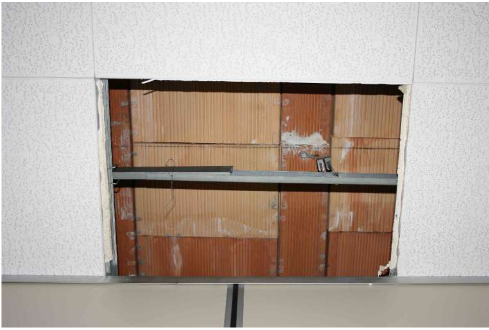
FOTOGRAFIA 07: PARTICOLARE SOLAIO IN LATERO-CEMENTO