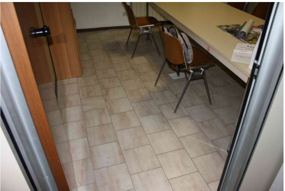
FOTOGRAFIA 02: UFFICIO 02 - PAVIMENTAZIONE IN GRES 30X30