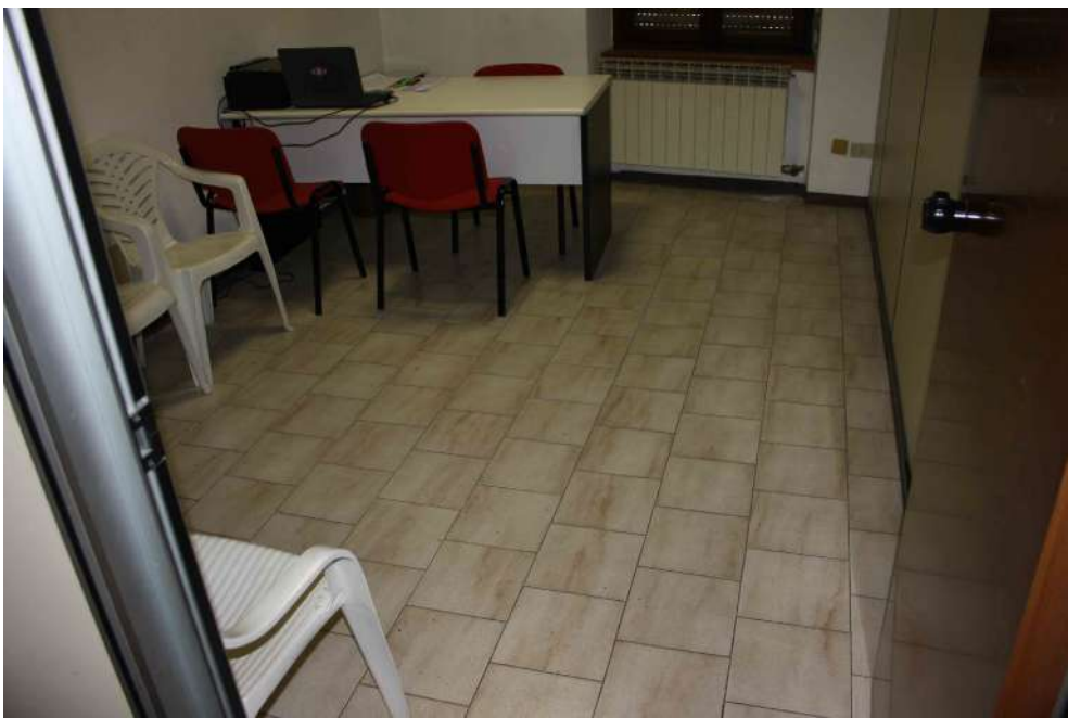
FOTOGRAFIA 01: UFFICIO 01 - PAVIMENTAZIONE IN GRES 30X30

PAVIMENTAZIONE IN GRES PORCELLANATO 30X30