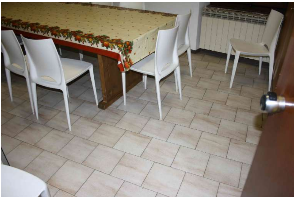
FOTOGRAFIA 03: UFFICIO 03 - PAVIMENTAZIONE IN GRES 30X30